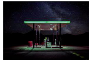
Clément COLLANGE Twelve Gasoline Stations , série numérique, tirage mat