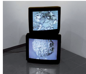
Edwin CUERVO Sätze , installation