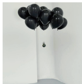
Guillaume LO MONACO Damoclès , installation ballons de baudruche