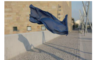
Manon ROUGIER Latence , photographie