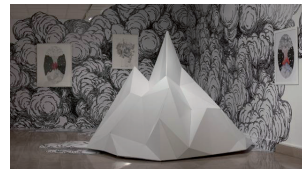
Kid Kreol & Boogie