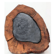
Keen SOUHLAL Pyrophyte I , installation